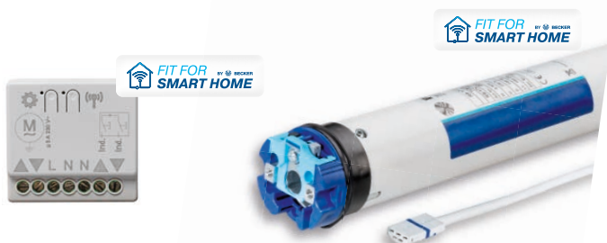
Beispielabbildungen Funkempfänger und -antrieb